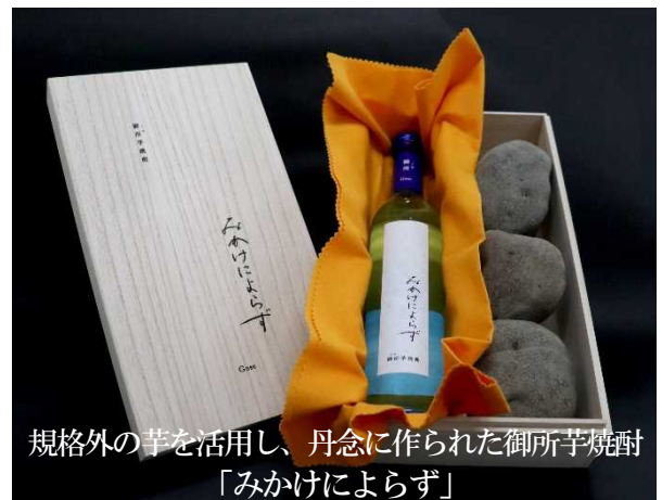
規格外の芋を活用し、丹念に作られた御所芋焼酎「みかけによらず」