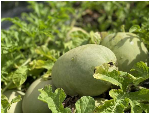
カラハリスイカの実